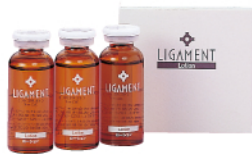
リガメント・ローション 30ml×3本 ¥6,800(税別)