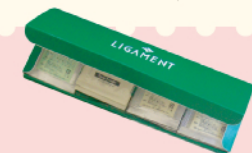
リガメント・サンプル4包セット ●クレンジングジェル(メイク落とし) 2g×4包 ●ソープパウダー(洗顔料) 1.3g×4包 ●ボディローション(化粧水) 2ml×4包 ●モイストチュアジェル(ジェル化粧水) 3g×4包

リガメント化粧品 まぎーあーす係 〒460-0011 愛知県名古屋市中区 大須3-17-24 3F E-mail info@ligament.co.jp