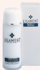
リガメント・ モイストチュア&サンリジェクト (UVカット化粧水) 30ml ¥2,700(税別)

微粒子パウダー(酸化チタン)が肌表面に分散して紫外線を散乱します。また、紫外線によって酸化、乾燥している肌細胞を素早く癒す保湿成分(ゲンチアナエキス、海塩、ラクトフェリン)を配合して、表皮内外を紫外線のダメージから守ります。