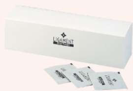
リガメント・ソープパウダー (パウダー洗顔料) 1.3g×90包 ¥3,500(税別)