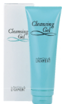
リガメント・クレンジングジェル 120g ¥3,500(税別)