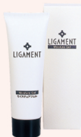
リガメント・モイストチュアジェル (ジェル化粧水) 120g ¥10,000(税別)

うるおった肌細胞は、そのままではまたしぼんでしまいます。配合成分の脂質(セラミド2)がうるおいをしっかりキープして、肌細胞をつなぎとめます。きめ細かい角質層は乾燥を防ぎ、外部の刺激から守ってくれます。さらに、加水分解卵殻膜の成分が保湿はもちろん、活性酸素除去やコラーゲン生成のシグナルになるといわれています。