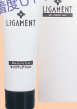
リガメント・モイシュアジェル (セラミド配合保湿ジェル)